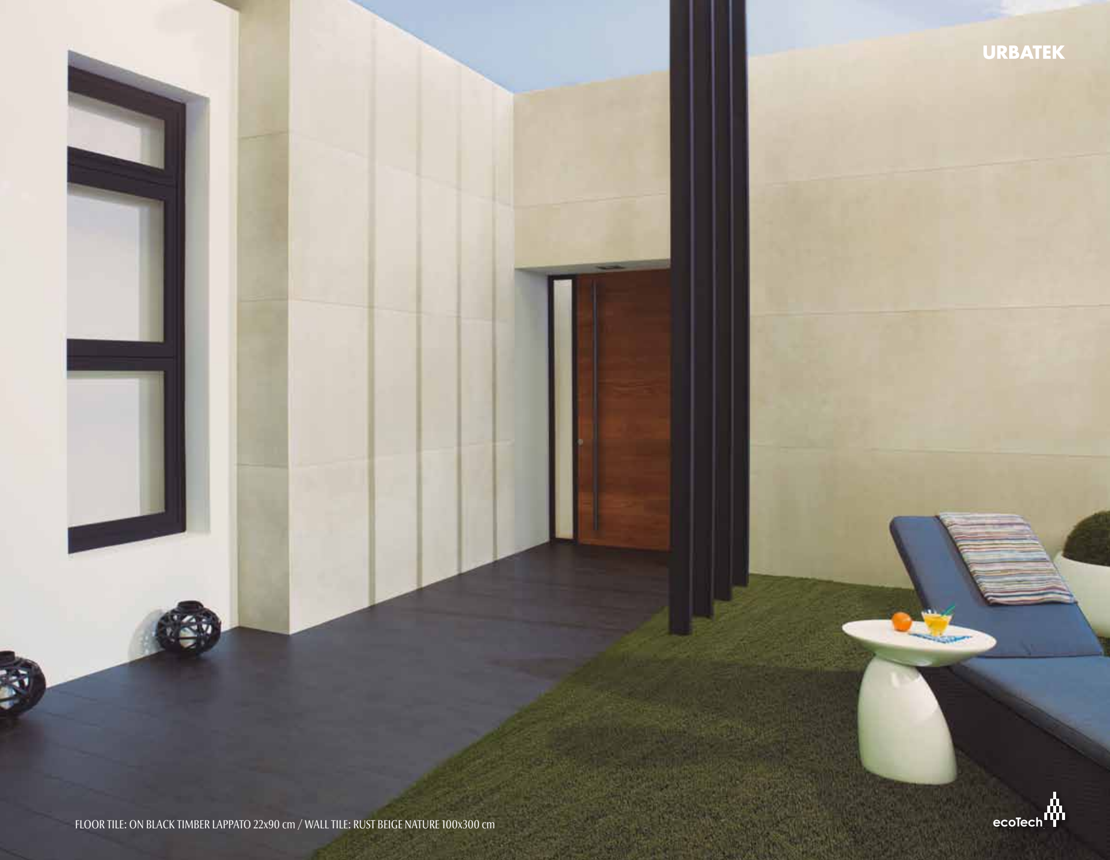
FLOOR TILE: ON BLACK TIMBER LAPPATO 22x90 cm / WALL TILE: RUST BEIGE NATURE 100x300 cm